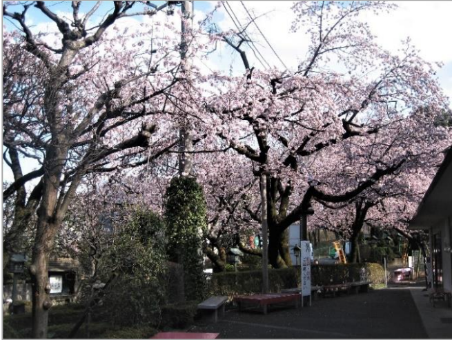
密蔵院の可憐な安行桜

一足早く咲く密蔵院の安行桜と 安行桜発祥の金剛寺・探索のツアーを 楽しみましょう!!