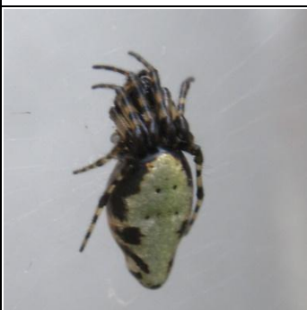
ギンメッキゴミグモ