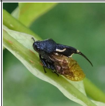
タケウチトゲアワブキ

→タケウチトゲアワブキはシナノキに依存。幼虫は自分の周りに管状の殻を築き、樹液を吸って暮らす。不要な汁は管の先から出す