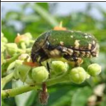
コアオハナムグリ