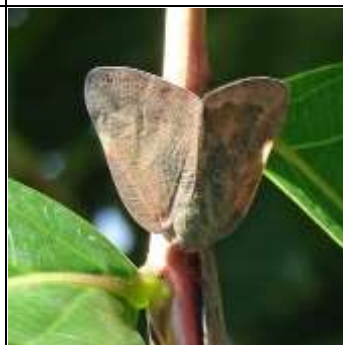
チュウゴクアミガサハゴロモ

原産中国。この仲間は幼 虫も成虫も枝などに口を 刺して樹液を吸うが、チ ュウゴクアミガサハゴロ モは対象種が多岐にわた る。集団で吸うため木が 弱ることがあり、警戒さ れている。翅の白い三角 形の模様が目印（日本産 は丸い）