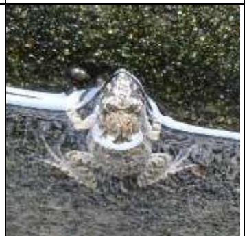
蛙になったばかりの幼体

小さな蛙がたんぼの側溝の 壁にへばりついてた。 蛙は泳ぎが得意。でもオタ マジャクシからカエルにな ると肺呼吸だから、ずっと 泳ぎつづけているとくたび れておぼれてしまう。 コンクリートの垂直の壁は 難所。