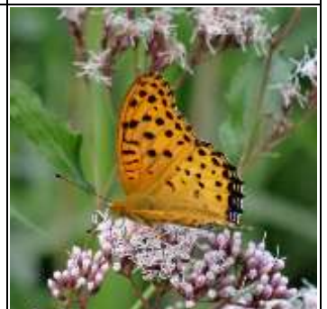
ツマグロヒョウモンオス

原産中国。この仲間は幼 虫も成虫も枝などに口を 刺して樹液を吸うが、チ ュウゴクアミガサハゴロ モは対象種が多岐にわた る。集団で吸うため木が 弱ることがあり、警戒さ れている。翅の白い三角 形の模様が目印（日本産 は丸い）