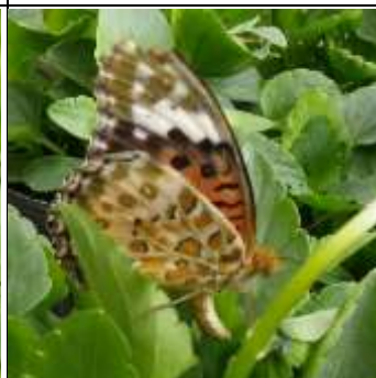
産卵するツマグロヒョウモン