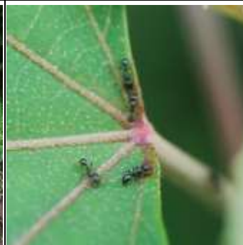
アカメガシワの葉とアリ

アカメガシワの葉とクサ ギの葉に似ているが、ク サギは対生、アカメガシ ワは互生。茎の色の違い などにも注目