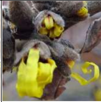
マンサクのつぼみ

←春、まず一番に咲くから「マンサク」。一つの花には細い花弁が4枚。開花前はつぼみの中に丸められて収まっている