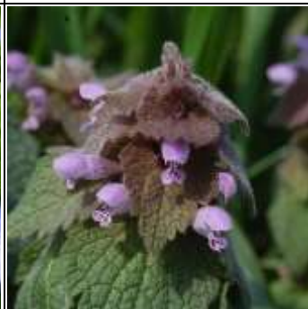
ヒメオドリコソウ

春一番に花をつけるのは青や紫の花。光の波長が長い色で遠くから虫に見つけてほしいから。 オオイヌノフグリはほかの草が伸びる前に青いじゅうたんを広げる。 ノボロギクはアスファルトの隙間から伸びて花をつける