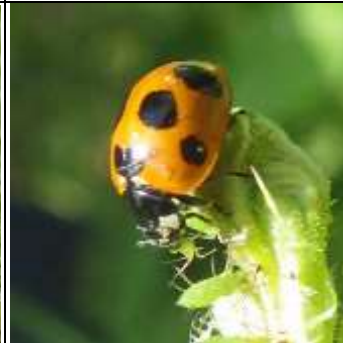
ナナホシテントウ

テントウムシは成虫で越冬する。 ナナホシテントウは春早くの暖かい日に出てくるので春を告げる虫として好まれる キイロテントウは植物につくカビを食べる