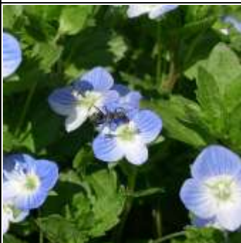
オオイヌノフグリ