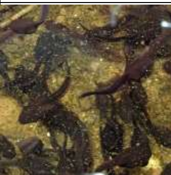
アカガエルオタマジャクシ

アカガエルの卵を探そう ニホンアカガエルは2月～3月、冬眠から起きて産卵 成体が暮らすのは森や屋敷林。水辺から遠い場合もあり、冬の夜、産卵のために移動するのは大変！ 水辺が減少するなどもあるため、生息数が減っている