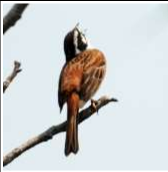
ホオジロさえずり