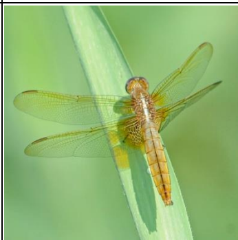
ショウジョウトンボ雌

ウスバキトンボは熱帯で生まれ、北へと旅をする。世代交代を繰り返しながら、さらに北へと進み、7月くらいに関東に到達。秋になって寒くなると死に絶える。一方通行しかできない種。