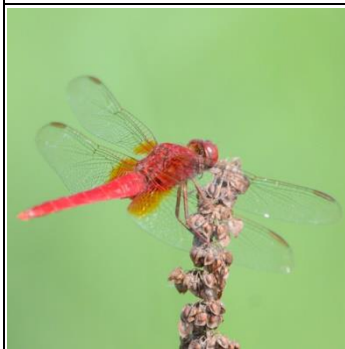
ショウジョウトンボ雄