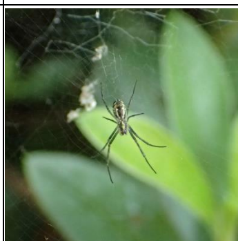
ジョロウグモ幼体

クモはまだ、ジョロウグモは小さい。巣の張り方に特徴がある。巣を張るクモの多くは頭部を下にし、腹側を見せている。